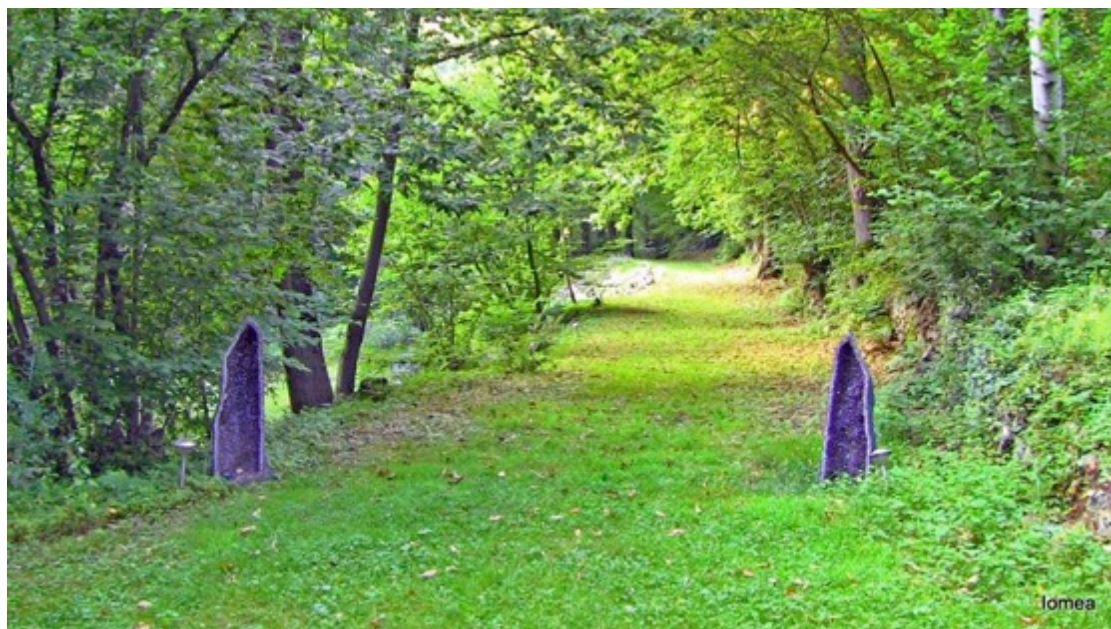
Bilde 1 Den særegne og frodige naturen i Piemonte skaper en spesielt god ramme rundt de magiske opplevelsene