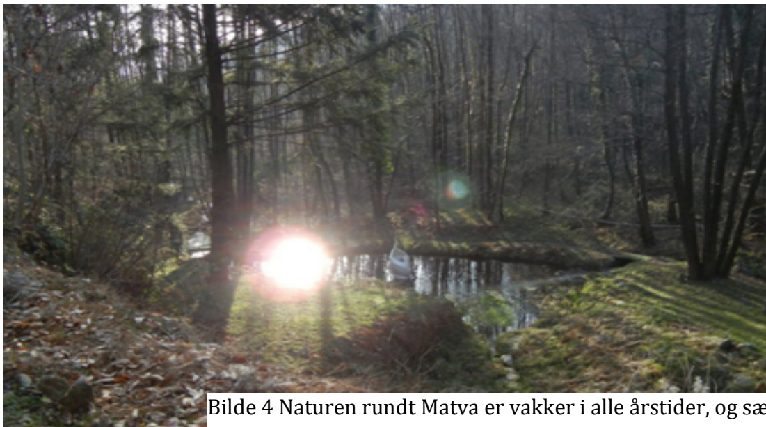
Bilde 4 Naturen rundt Matva er vakker i alle årstider, og særlig i mai