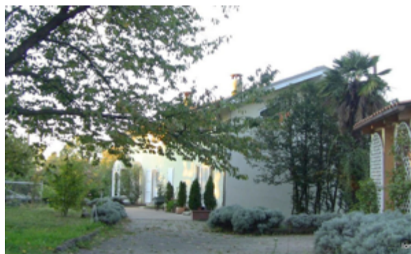
Bilde 2 Matvas frodige hage og inngangsparti

MATVA er en særegen og vakker kursgård, omkranset av en fantastisk hage og en eiendom på 40 mål, i Piemonte i Nord-Italia. Nærmeste byer er Torino and Milano. Matva er en fredfylt og grønn oase. Det er 3 hus på eiendommen og